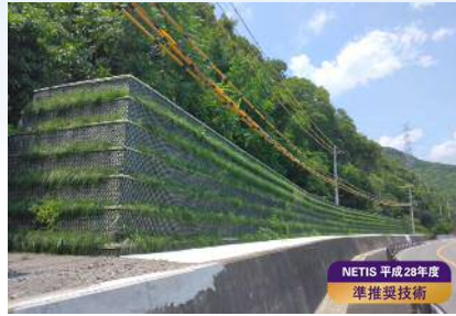
落石防護補強土壁