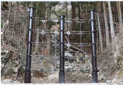
小規模溪流向け杭式（杭基礎）土石流・流木対策工