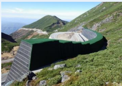
落石防護補強土壁 ジオロックウォール (模型展示) NETIS登録番号: HR-990009-V (NETIS 平成28年度 準推奨技術)