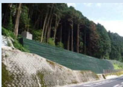
落石防護補強土壁 ジオロックウォール （模型展示） NETIS登録番号：HR-990009-V （NETIS 平成28年度 準推奨技術）