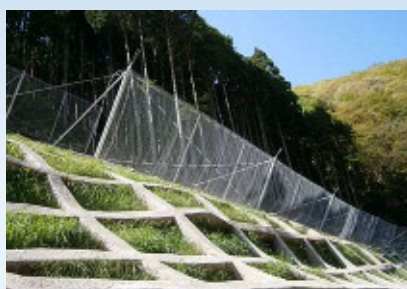
エネルギー吸収型小規模落石防護柵 ARC（アーク）フェンス NETIS登録番号：CB-020004-VE （NETIS 平成29年度 評価促進技術）