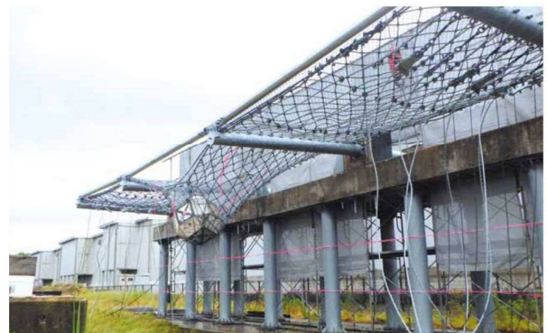
実物供試体に対する重錘自由落下実験(重錘補足状況)

各地において局地的な大雨が記録されている昨今、防災・減災対策を強化する国土強靱化に向けた計画がとりまとめられています。多発する土砂災害対策への対応が急務となっており、対策製品の需要も高まりを見せています。このような中、強みの一貫体制をより強化して生産性の向上を図るとともに、製品の開発や改良にも積極的に取り組んでいきます。また、現場からのフィードバックによる品質向上と技術の蓄積のため、施工体制の強化を図っていきます。かけがえのない生命や財産、環境を守るため、豊富な選択肢を提供できる自然災害対策のトータルソリューションカンパニーを目指していきます。