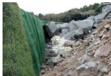
極めて優れた衝撃吸収性能を持つジオロックウォール

世の中に安心・安全を届けるという想いを込め、コーポレートブランドとして「安全の創造」を掲げるなど、「安全」に対する強い意識を持っている。製品開発に際して、長いものでは3~5年かけて実証実験を行い、安全性の確保に努めている。同社の代表製品「ジオロックウォール」は特殊繊維で補強した土の擁壁であるが、土はコンクリートに比べ効率よく衝撃を吸収するため、落石などを確実に受け止めることが可能。同製品の開発に際しては旧道路公団の技術研究所と補強土防護擁壁協会とで共同実験を行い、衝撃荷重特性を確認済。