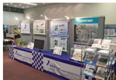
「Made in 新潟(土木・建築)新技術展示会・活用発表会」の様子

部材の一部は地元燕三条を中心とした地元新潟県内金属産地部材製作下請け企業から調達しており、地域資源活用・経済活性化に貢献している。新潟県が比較的優位性を持つ斜面災害対策分野で、地元大学である新潟大学等と共同研究を行うことで、斜面防災対策技術や工法の開発など技術水準の向上に貢献している。同社製品は斜面災害被害が多発する新潟県で開発製品化されており、新潟県の産業振興に貢献したとして、「Made in 新潟 プラチナ技術」認定や、新潟県知事表彰「技術賞」受賞の実績がある。